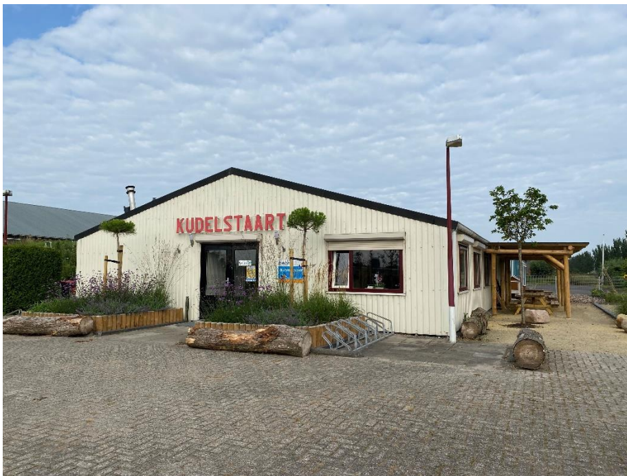
www.solidoe.nl Kudelstaart juni 2021

Adres locatie: Bilderdammerweg 116, 1433 HJ Kudelstaart Telefoonnummer: